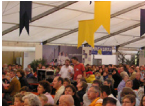
Wiga-Gottesdienst im Zelt